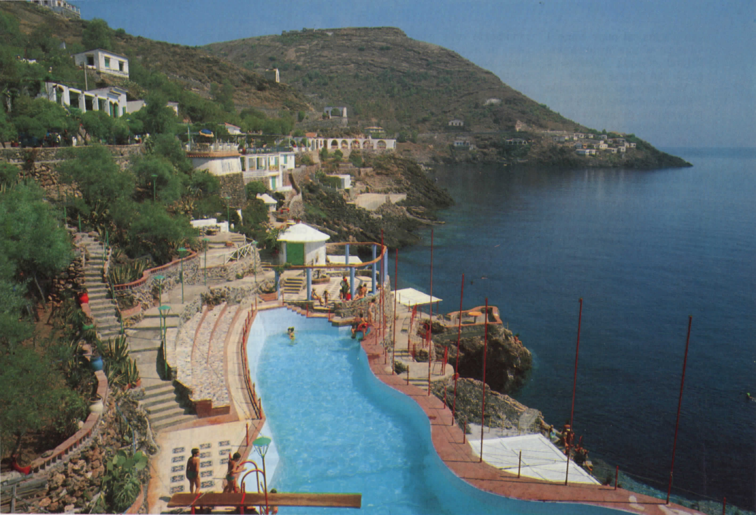
In alto: il porticciolo di Ustica; a sinistra: un branco di piccole ricciole; sopra: la piscina dell'Hotel Grotta Azzura; sotto: esplosione colorata di una colonia di Parazoantus; a destra: una delle grosse cernie dei fondali dell'isola.